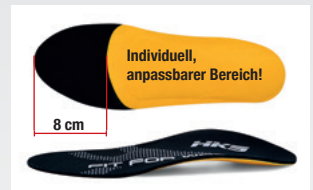
Abb. 01 Nicht veränderbarer Bereich, ca. 8 cm von der Fußbettspitze zum Ballenbereich.

Die so gefertigten Einlagen entsprechen der DGUV112-191 und können in Ihre HKS®-Sicherheitsschuhe problemlos eingelegt und getragen werden.