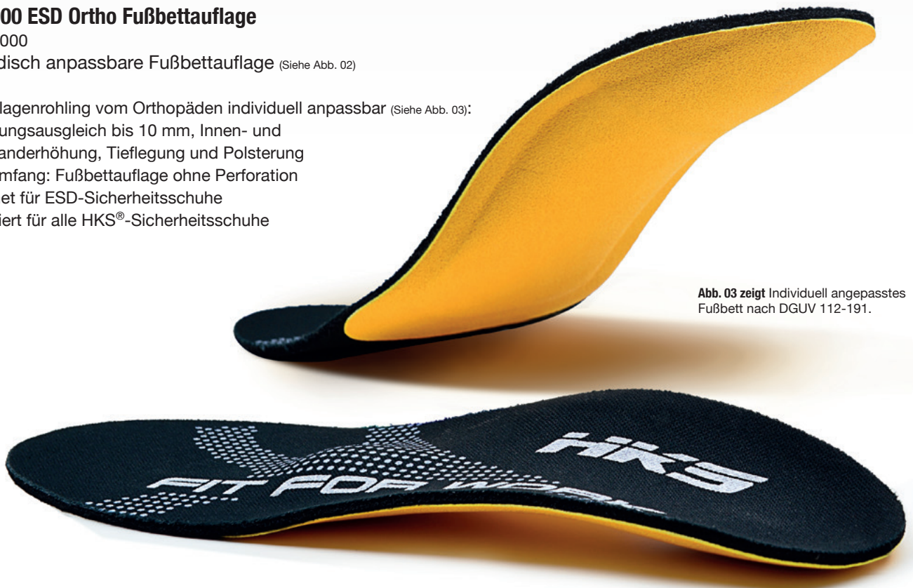
Abb. 03 zeigt Individuell angepasstes Fußbett nach DGUV 112-191.