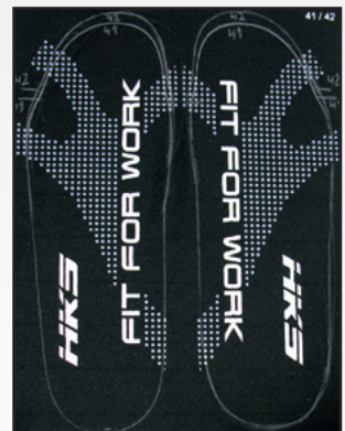
Abb. 02 Fußbettauflage